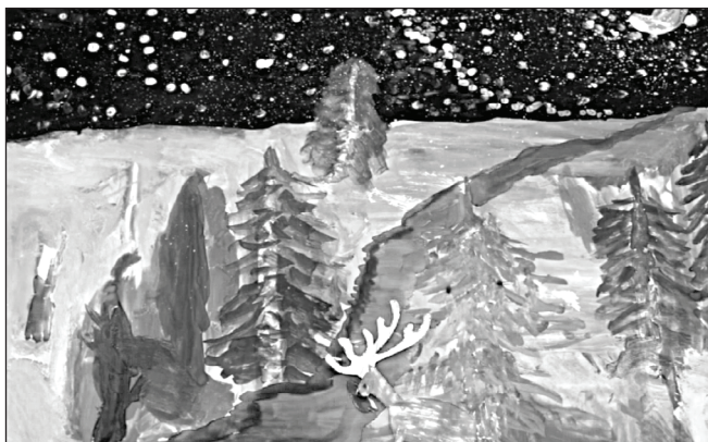
■ Яркий четырёхминутный мультфильм — результат усилий огромной команды, трудившейся над ним в течение двух месяцев. Только вдумайтесь: для его создания пришлось сделать 350 кадров!

Четвёртый шаг — монтаж . Мультфильмы обрабатывались в программе «Киностудия». Мы убра-